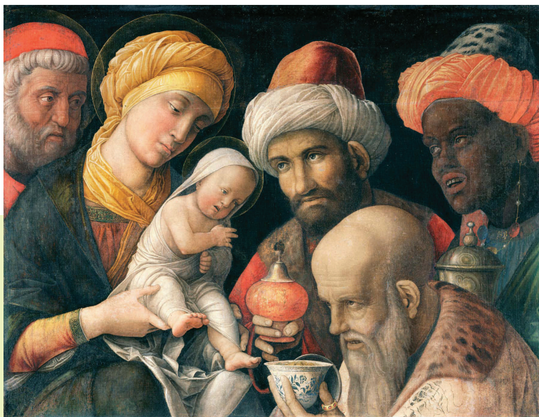
S. Efrem il Siro

Maria: Esulti la Chiesa e canti la gloria, per la nascita del figlio dell'Altissimo, la cui aurora ha rischiarato cielo e terra. Benedetto Colui la cui nascita rallegra l'universo!