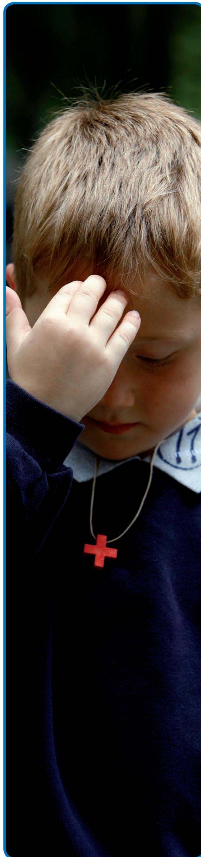
© Imprimerie de la Grotte / Sanctuaires Notre-Dame de Lourdes Impression EURL Basilique du Rosaire - Octobre 2009 - Photos VINCENT

P. Régis-Marie de La Teyssonnière e P. Horacio Brito